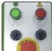
Rychlost otáčení kruhu