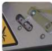
Automatický stříh a zavedení folie