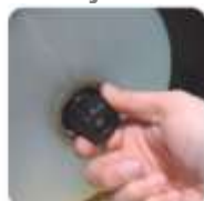
Nastavení tahu folie