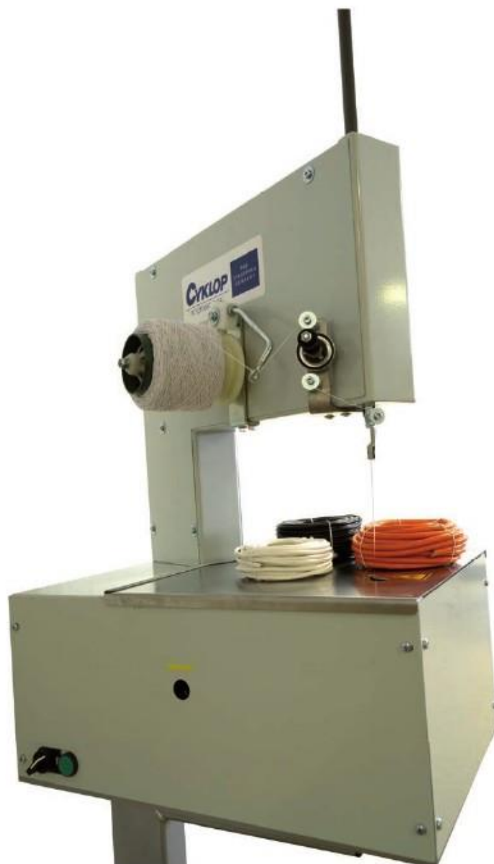
SVAZKOVACÍ STROJ MODEL: AXRO IN2